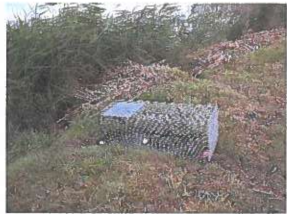
Cage-piège sélective

☛ La lutte contre les rongeurs aquatiques (ragondins et rats musqués) permet de diminuer les risques de contracter la leptospirose (20 % des ragondins et 35 % des rats musqués sont potentiellement excréteurs de cette bactérie - étude 2010).